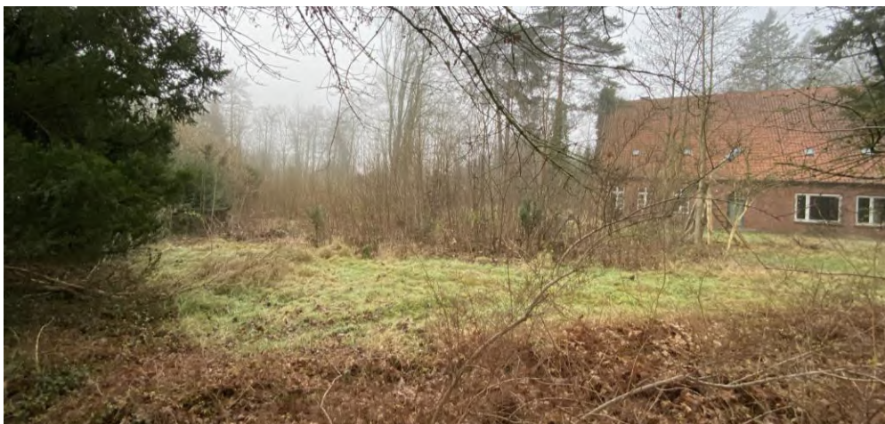
Abbildung 14: Prüfstandort Am Alten Stadtgraben

Der Prüfstandort an der Straße ‚Am Alten Stadtgraben‘ befindet sich im nord-westlichen Bereich des zentralen Versorgungsbereichs, gegenüber des Bürgeramts Soltau. Die Fläche ist derzeit durch die bewaldete Grünfläche der Kirche geprägt. Aufgrund der Lage an der L 163 ist das Grundstück grundsätzlich gut zu erreichen. Gleichwohl ist der Verkehrsweg zu dem Grundstück über die L 163 noch nicht erschlossen und es stellt sich angesichts der Nähe zur stark frequentierten Kreuzung L 163/ B 71 auch die Frage, ob es verkehrstechnisch überhaupt möglich wäre, auf der L 163 eine Zu- und Abfahrt einzurichten. Auch vom Rühberg aus oder von der B 71 besteht aktuell keine Zuwegung. Dementsprechend wäre mit der Vorhabenrealisierung voraussichtlich ein größerer Eingriff in die Straßenführung verbunden. Die Anbindung an den ÖPNV erfolgt über die Bushaltestellen ‚Johanniskirche‘, ‚Mühlenstraße‘ und ‚Wilhelmstraße‘ in rd. 300 m bis 400 m Entfernung. Ergänzend ist der Standort sowohl zu Fuß als auch mit dem Rad gut zu erreichen. Der FNP weist die Fläche als Kerngebiet aus und im hier relevanten B-Plan Nr. 72 sind die betreffenden Flächen als Gemeinbedarf „Kirche“, Mischgebiet und Privates Grün festgesetzt.