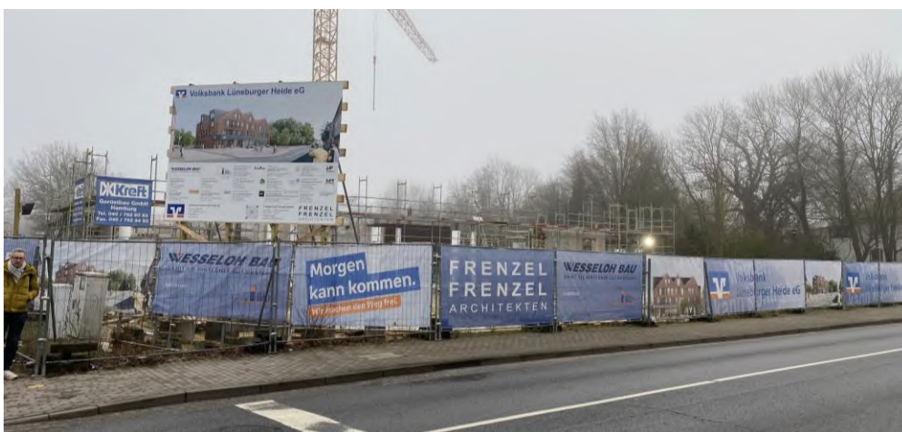
Abbildung 3: Derzeit entstehendes Volksbankgebäude an der Wilhelmstraße

Das unmittelbare Standortumfeld ist von heterogenen Bebauungs- und Nutzungsstrukturen geprägt. Unmittelbar nördlich des Standorts grenzt Wohnbebauung in Form von Einzel- und Mehrfamilienhäusern an. Direkt östlich der Potenzialfläche verläuft die Böhme, welche in den gleichnamigen Böhme Familienpark eingebettet ist, der für die Innenstadt als Erholungs- und Naturraum fungiert, so dass hier Konflikte mit dem verkehrserzeugenden Getränkemarkt zu erwarten wären. Ein weiterer Nutzungskonflikt ergibt sich mit der westlich der Potenzialfläche verorteten Grundschule. In südlicher Richtung befindet sich zunächst das derzeit in Entwicklung befindliche Volksbank-Areal, ehe sich dann – getrennt durch die B 71 – der Haupteinkaufsbereich des ZVB Innenstadt Soltau anschließt.