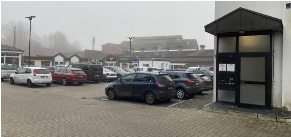
Abbildung 6: Stellplatzfläche und Gastronomiebetriebe in der Wilhelmstraße 12