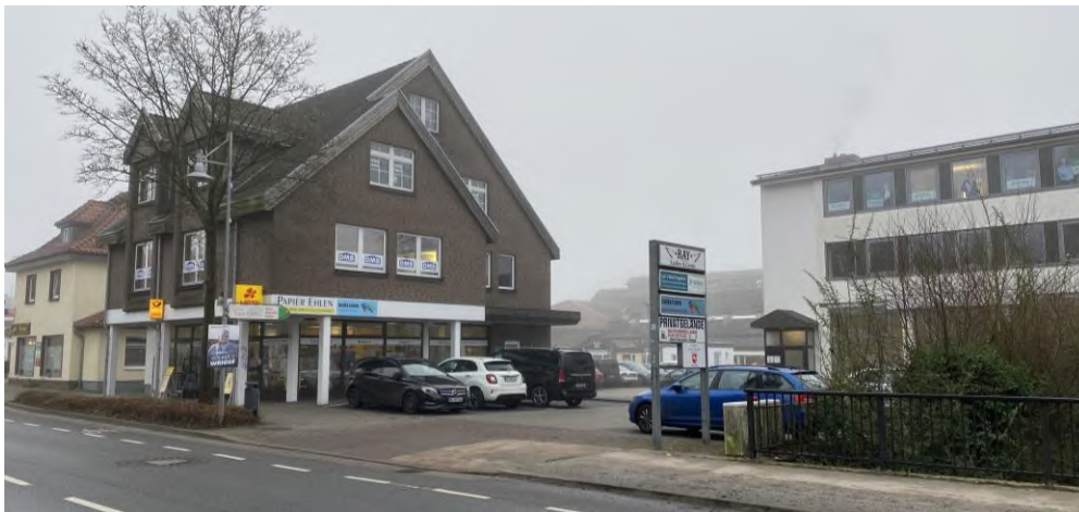
Abbildung 5: Schreibwarenfachgeschäft Ehlen in der Wilhelmstraße 10

Bereich bereits heute schon sehr hoch und führt teilweise zu großem Rückstau der Fahrzeuge. 4 Die Anbindung an den ÖPNV erfolgt über die Bushaltestelle ‚Wilhelmstraße‘ am Standort. Darüber hinaus ist die fußläufige Erreichbarkeit gesichert. Im FNP ist die Fläche als Kerngebiet dargestellt – ein B-Plan besteht nicht.