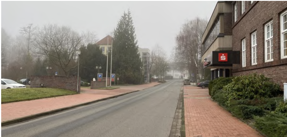
Abbildung 12: Blick entlang der Straße 'Rühberg' in Richtung Norden