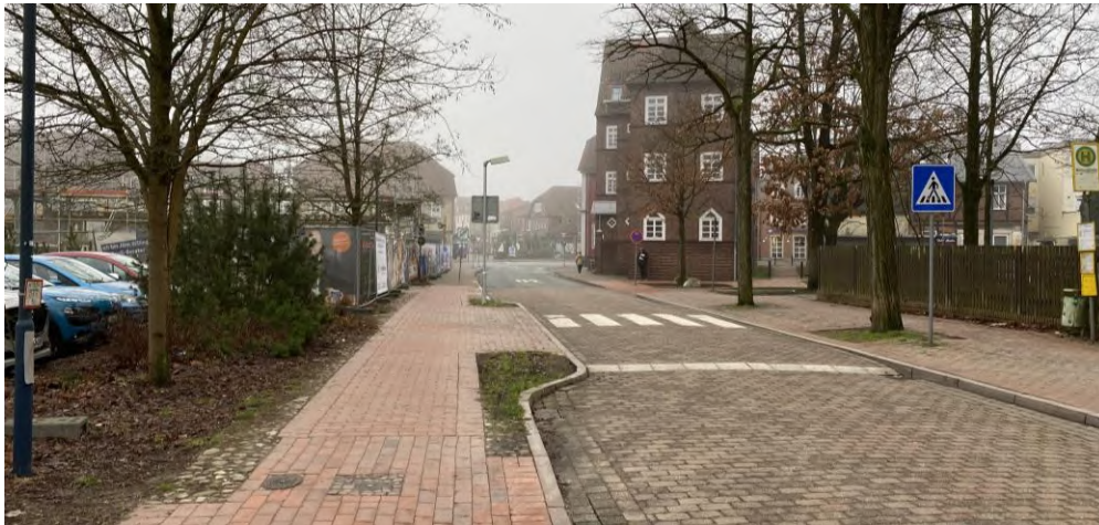
Abbildung 4: Blick entlang der Mühlenstraße in Richtung Süden

Der Prüfstandort befindet sich im zentralen Siedlungsgebiet der Stadt Soltau und schließt unmittelbar an die Innenstadt an und ist somit grundsätzlich für einen Nahversorgungsbetrieb geeignet. Die Grundstückfläche von etwa 5.000 qm ist ausreichend groß bemessen und der Flächenzuschnitt wäre geeignet, um den Getränkemarkt hier ansiedeln zu können. Allerdings ist nochmals auf die verkehrliche Erschließung und die Nähe zu einer Grundschule und zum Böhme-Familienpark zu verweisen, wobei die städtebauliche Sinnhaftigkeit eines verkehrsinduzierenden Getränkemarkts, dessen Sortiment durch den typischen „Kofferraumeinkauf“ geprägt ist, in diesem Bereich stark infrage gestellt werden darf. Darüber hinaus bestehen seitens der Stadt Soltau bereits konkrete Planungen, die Mühlenstraße zu einer Fahrradstraße zu entwickeln. 3 Dementsprechend ist die verkehrliche Erreichbarkeit zukünftig stark eingeschränkt, so dass der Prüfstandort Mühlenstraße als Standortalternative nicht in Frage kommt.