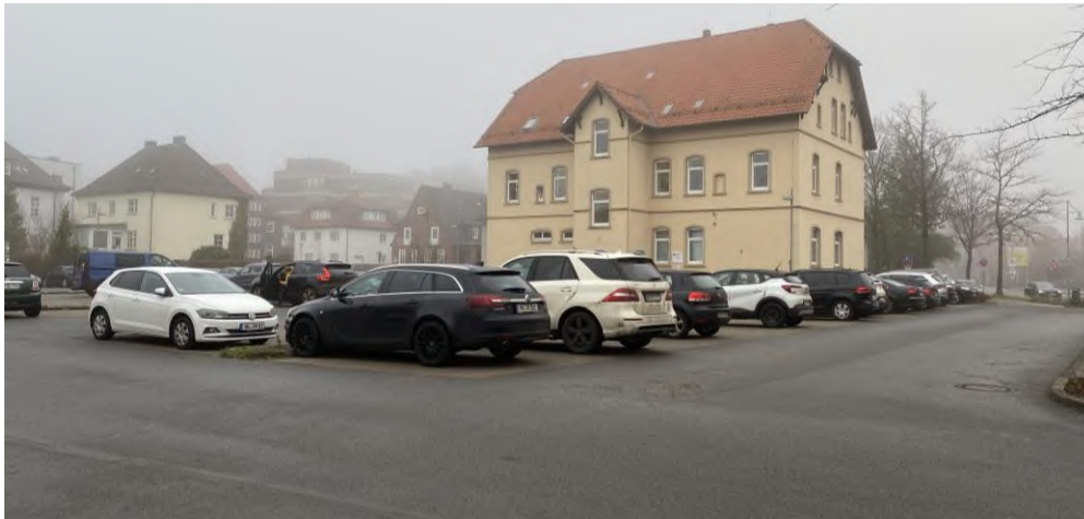
Abbildung 8: Stellplatzanlage des Amtsgerichts Soltau