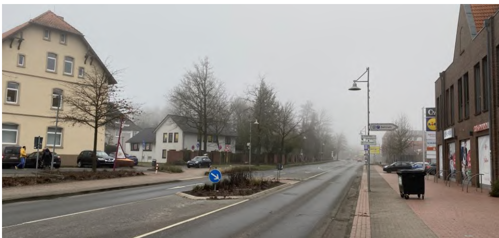
Abbildung 10: Blick entlang der L 163 in Richtung Norden