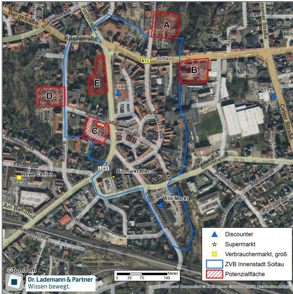
Abbildung 1: Zu prüfende Alternativstandorte innerhalb der Innenstadt von Soltau

In der folgenden Karte sind, die nach einer ersten Sichtung identifizierten, potenziellen Alternativstandorte zusammenfassend dargestellt. Für diese Flächen erfolgt dann im Folgenden eine detaillierte Prüfung.