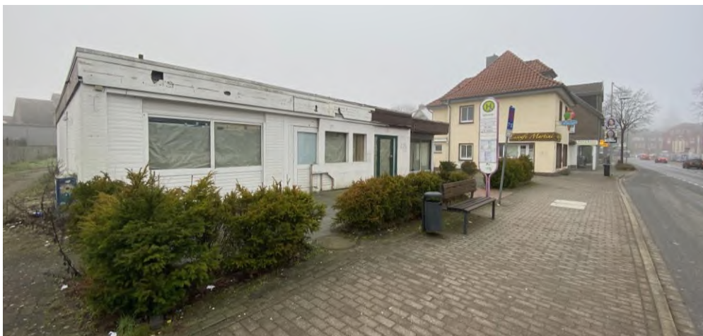
Abbildung 7: Leerstehende Immobilie in der Wilhelmstraße 14

Der Prüfstandort liegt im zentralen Siedlungsgebiet und ist somit grundsätzlich für einen Nahversorgungsbetrieb geeignet. Die Grundstückfläche von etwa 5.000 qm ist ausreichend groß bemessen und der Flächenzuschnitt wäre geeignet, um den Getränkemarkt hier ansiedeln zu können. Allerdings sind größere Teile der Fläche noch in Nutzung und bestehende Baukörper müssten abgerissen werden, um die Fläche für den Getränkemarkt nutzbar zu machen.