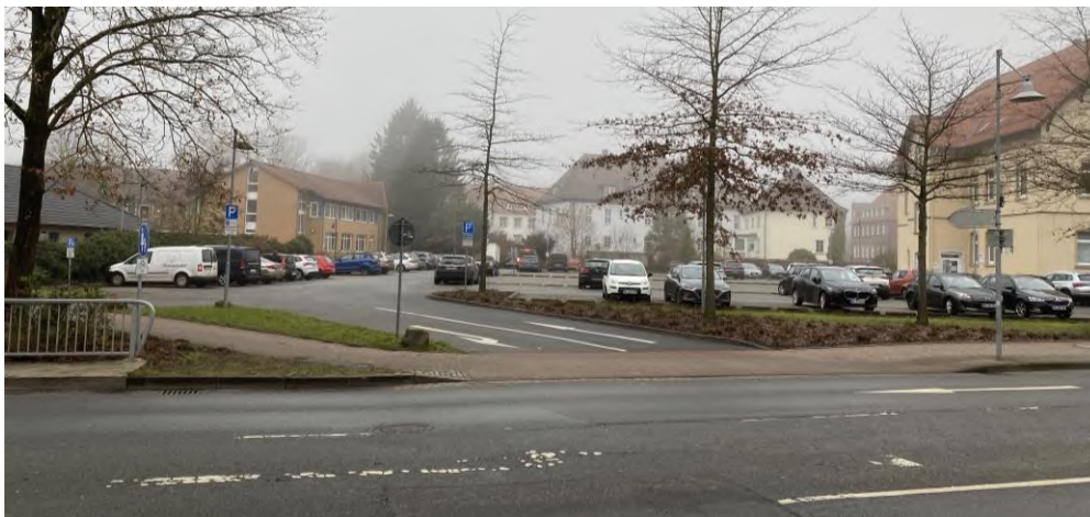
Abbildung 9: Zu- und Abfahrt der Stellplatzanlage auf die L 163