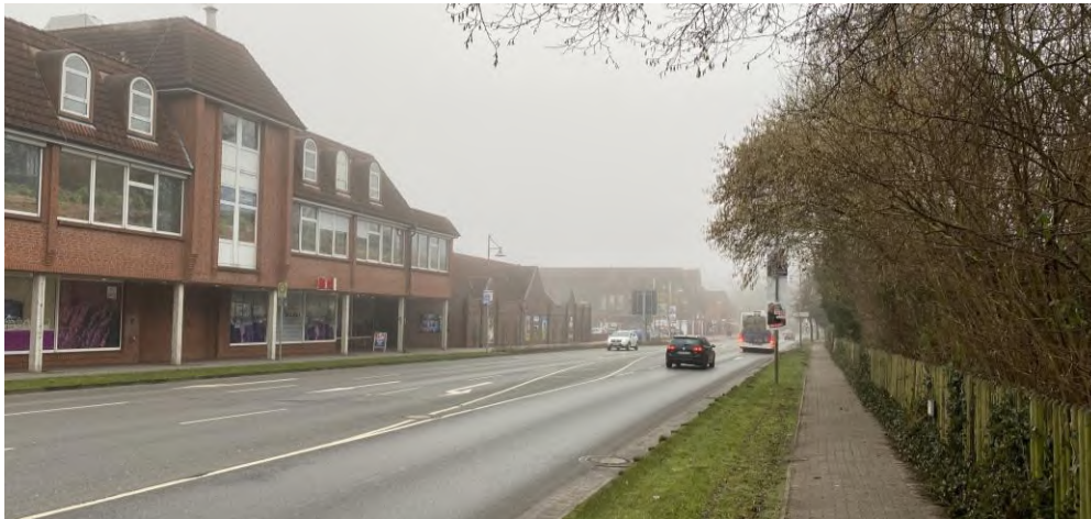
Abbildung 15: Blick entlang der L 163 in Richtung Süden

Das unmittelbare Standortumfeld ist von heterogenen Bebauungs- und Nutzungsstrukturen geprägt. Unmittelbar nördlich grenzen eine Filiale der Bausparkasse sowie ein Museum an und ferner verläuft hier die B71 in West-Ost-Richtung. Direkt östlich der Potenzialfläche prägt der Verlauf der L 163 das Umfeld und dieser gegenüberliegend beginnt der Haupteinkaufsbereich der Innenstadt, wo mit Rossmann, Lidl und C&A große Magnetbetriebe der Innenstadt angesiedelt sind. In südlicher Richtung befinden sich vereinzelt Wohnhäuser, ehe sich das Amtsgericht anschließt. Unmittelbar westlich befinden sich neben einer Kirche noch weitere konfessionelle Einrichtungen.