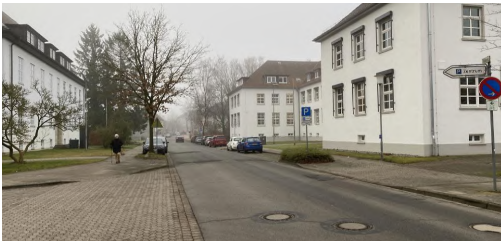
Abbildung 13: Kreuzungsbereich Rühberg/Blumenstraße

Das unmittelbare Standortumfeld wird neben vereinzelt Wohngebäuden und vor bewaldeten Grünflächen im Norden vor allem durch größere Bürogebäude geprägt, darunter direkt gegenüber die Kreissparkasse Soltau und in südlicher Richtung das Finanzamt Soltau und das Amtsgericht. In westlicher Richtung befinden sich vorwiegend bewaldete Grünflächen.