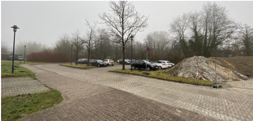
Abbildung 2: Nördlicher Teil der Stellplatzanlage in der Mühlenstraße

Das unmittelbare Standortumfeld ist von heterogenen Bebauungs- und Nutzungsstrukturen geprägt. Unmittelbar nördlich des Standorts grenzt Wohnbebauung in Form von Einzel- und Mehrfamilienhäusern an. Direkt östlich der Potenzialfläche verläuft die Böhme, welche in den gleichnamigen Böhme Familienpark eingebettet ist, der für die Innenstadt als Erholungs- und Naturraum fungiert, so dass hier Konflikte mit dem verkehrserzeugenden Getränkemarkt zu erwarten wären. Ein weiterer Nutzungskonflikt ergibt sich mit der westlich der Potenzialfläche verorteten Grundschule. In südlicher Richtung befindet sich zunächst das derzeit in Entwicklung befindliche Volksbank-Areal, ehe sich dann – getrennt durch die B 71 – der Haupteinkaufsbereich des ZVB Innenstadt Soltau anschließt.