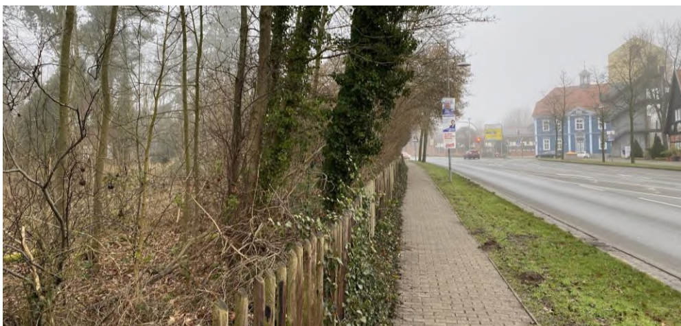
Abbildung 16: Blick entlang der L 163 in Richtung Norden

Das unmittelbare Standortumfeld ist von heterogenen Bebauungs- und Nutzungsstrukturen geprägt. Unmittelbar nördlich grenzen eine Filiale der Bausparkasse sowie ein Museum an und ferner verläuft hier die B71 in West-Ost-Richtung. Direkt östlich der Potenzialfläche prägt der Verlauf der L 163 das Umfeld und dieser gegenüberliegend beginnt der Haupteinkaufsbereich der Innenstadt, wo mit Rossmann, Lidl und C&A große Magnetbetriebe der Innenstadt angesiedelt sind. In südlicher Richtung befinden sich vereinzelt Wohnhäuser, ehe sich das Amtsgericht anschließt. Unmittelbar westlich befinden sich neben einer Kirche noch weitere konfessionelle Einrichtungen.