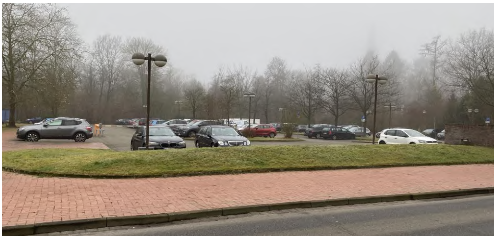
Abbildung 11: Parkplatz der Kreissparkasse Soltau in der Straße ‚Rühberg‘

Die Potenzialfläche in der Straße ‚Rühberg‘ 10 wird derzeit durch die Stellplatzanlage der Kreissparkasse Soltau genutzt und befindet sich auch in deren Besitz. Der Standort schmiegt sich direkt an den zentralen Versorgungsbereich an, wenngleich keine direkte Sichtbeziehung zum Kernbereich der Innenstadt besteht und es sich hierbei eher um eine städtebauliche Randlage handelt. Die verkehrliche Erreichbarkeit des Standorts ist über die Straße ‚Rühberg‘, mit Anbindung an die B 71 im Norden und die L 163 in südlicher Richtung, grundsätzlich gegeben, wenngleich der Straßenquerschnitt für ein höheres Verkehrsaufkommen nicht optimal ist. Die Anbindung an den ÖPNV erfolgt über die Bushaltestelle ‚Johanniskirche‘ in rd. 300 m nördlicher Entfernung. Darüber hinaus ist die fußläufige Erreichbarkeit gesichert. Im FNP ist die Fläche als Gemischte Baufläche dargestellt. Zudem liegt die Fläche im Geltungsbereich des B-Plans Nr. 20 und ist als Fläche für den Gemeinbedarf (öffentliche Verwaltung) festgesetzt.