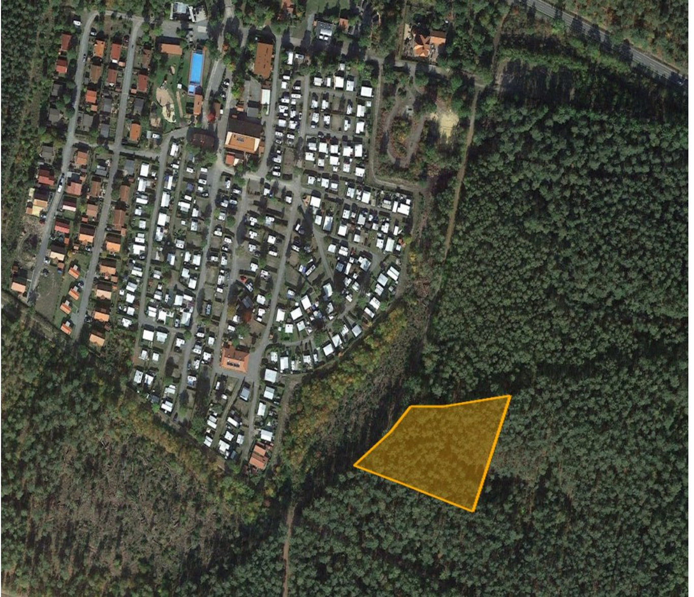
Abbildung 3: Lage und Größe der Pflanzfläche mit ca. 5176 m 2

Über Maßnahmen zur Verbesserung des Naturhaushaltes sind daher 5176 m 2 zu kompensieren.