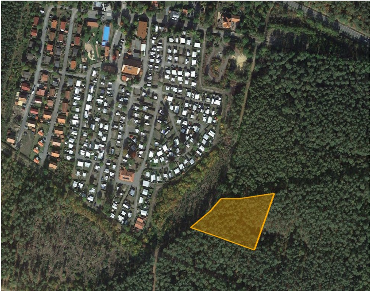
Abbildung 1 | Fläche für Maßnahme zur Verbesserung des Naturhaushaltes – ca. 5176 m 2

Die geplante Kompensation über Maßnahmen zur Verbesserung des Naturhaushaltes findet auf den Flächen angrenzend an den Eingriffsort statt. Dieser liegt in der Waldbauregion Mittel-Westniedersächsisches Tiefland und Hohe Heide im Wuchsbezirk „Hohe Heide“.